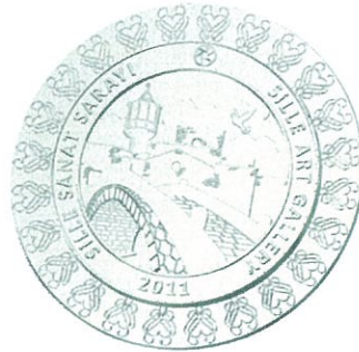
SSS Gümüş Madalya