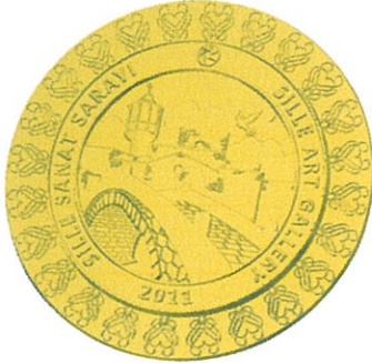
SSS Altın Madalya

Sille Sanat Sarayı altın, gümüş ve bronz madalayaları çelik metalden üretilmiş olup gerçek altın, gümüş ve bronz değildir. Düzenlenen diğer fotoğraf yarışmalarında olduğu gibi verilen ödülün değerini belirlemek amacıyla bu şekilde adlandırılmıştır