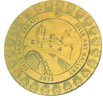
SSS Bronz Madalya